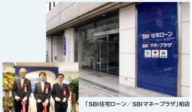
「SBI住宅ローン／SBIマネープラザ」柏店 銀座(3号店)オープニングセレモニー

そのほかに、SBIグループではSBIオートサポートを活用して、SBI損害保険の自動車保険や住信SBIネット銀行のオートローンなど自動車関連金融商品のリアルチャネル展開を進めています。