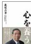
『心を養う』 財界研究所 2021年4月