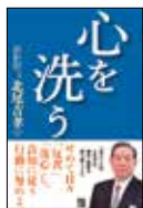
『心を洗う』 経済界 2019年10月