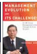
『挑戦と進化の経営』

幻冬舎 2019年6月 (韓)毎日経済新聞社 2020年6月 (英)One Peace Books, Inc. 2020年12月