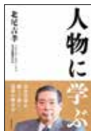
『人物に学ぶ』 財界研究所 2022年4月