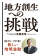
『地方創生への挑戦』 きんざい 2021年1月