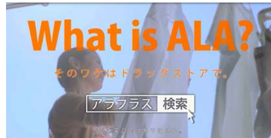
女性 (家事) 篇