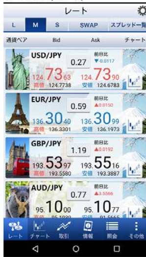
レート画面（モチーフ）