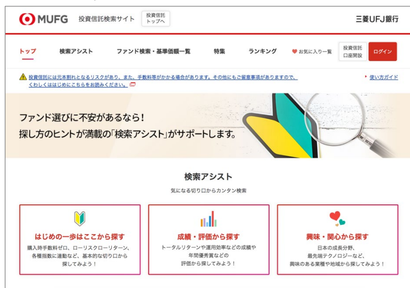
<三菱UFJ銀行「投資信託検索サイト」トップ画面イメージ>

当社は、三菱UFJ銀行の「投資信託検索サイト」を通じて、顧客の意向に応じた最適な資産形成の実現をサポートいたします。