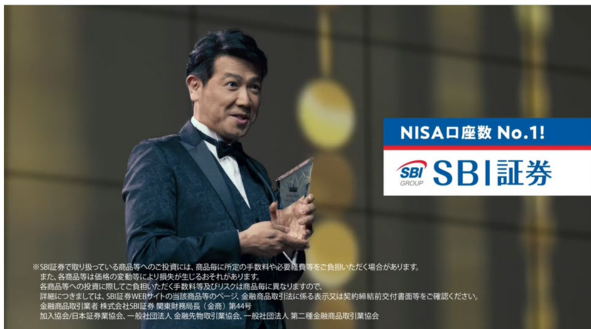
「NISA口座数 No.1 SBI証券」篇

株式会社 SBI証券(本社:東京都港区、代表取締役社長:高村正人、以下「当社」)は、2021年8月13日(金)から、俳優・別所哲也さんを起用した TVCM「NISA口座数 No.1 ※1 SBI証券」篇、「iDeCo 加入者数 No.1 ※2 SBI証券」篇、「取引シェア No.1 ※3 SBI証券」篇の放映を開始します。また、放映に先駆けて 2021年6月25日(金)から YouTube で先行公開し、2021年7月5日(月)から都内タクシーCMを開始します。