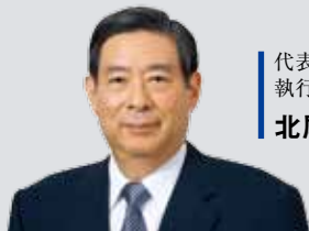
代表取締役 執行役員社長 北尾 吉孝

(株)SBI証券代表取締役会長 SBIインベストメント(株)代表取締役執行役員会長 モーニングスター(株)取締役 SBIキャピタルマネジメント(株)取締役 SBIファイナンシャルサービス(株)取締役 SBI Hong Kong Holdings Co., Limited代表取締役