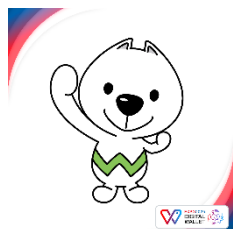
和歌山県 PR キャラクター「きいちゃん」

https://furusato.sbigroup.jp/entry/2024/12/18/campaign