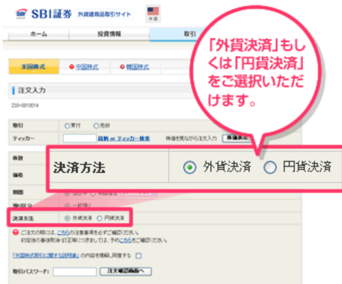
【画面イメージ：注文入力画面】

3) 保有の外貨建商品（外貨建債券・外貨建 MMF 含む）の資産情報が「外貨」と「円貨」でご確認いただけます。「外貨建商品取引サイト」では、口座サマリー画面などで外国株式のみならず、その他の外貨建商品（外貨建債券・外貨建 MMF）の情報も閲覧可能となります。さらに、外貨での情報のみならず、円貨での情報もご確認いただけるようになります。