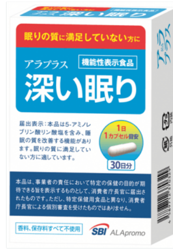
アラプラス 深い眠り(30日分)