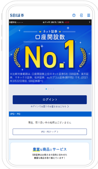
スマホサイトトップ画面