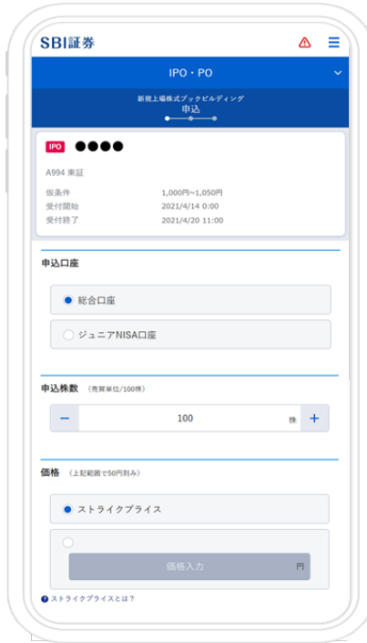
ブックビルディング申込画面