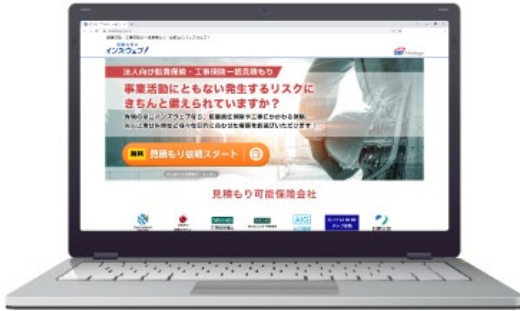
トップページ（パソコン）