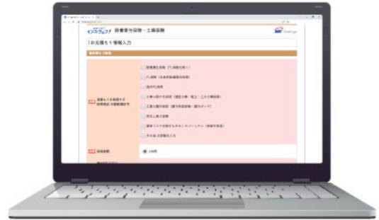
入力ページ（パソコン）