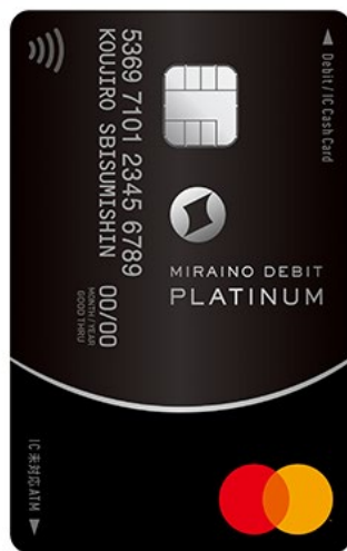
ミライノデビットPLATINUM (Mastercard)