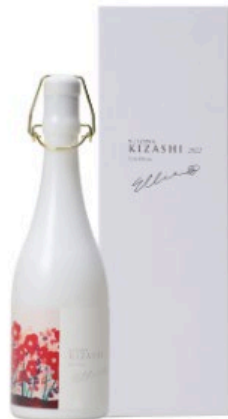
NIIZAWA KIZASHI 純米大吟醸