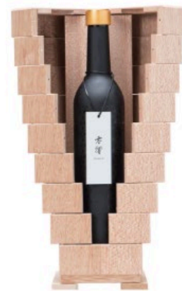
零響 -Absolute 0-