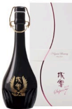
超特選 純米大吟醸 残響 Super7