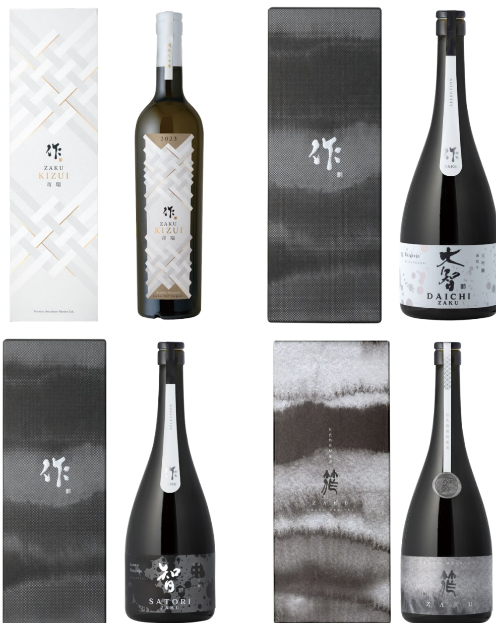
清水清三郎商店・日本酒の代表銘柄「作（ZAKU）」シリーズのうち、「SHIMENAWA（しめなわ）」先行導入予定商品

そこで世界中で「SAKE」を通じて国や世代を問わず、人と人がつながり、かけがえのないひと時が過ぎていく。そんな時を紡ぎ、人をつなぐお手伝いをしていくことを目指している清水清三郎商店としてこの世界的な潮流に乗り、代表銘柄「作（ZAKU）」ブランドで伝統産業の酒造りと新しいテクノロジーを融合させ、これまでタッチポイントの創出が困難であった若い世代を中心とした新たな顧客層・ファンをグローバルに獲得していくと共に、ファン同士、ファンとブランドの新しいつながり方の構築も目指していくために「SHIMENAWA（しめなわ）」を導入することにしました。