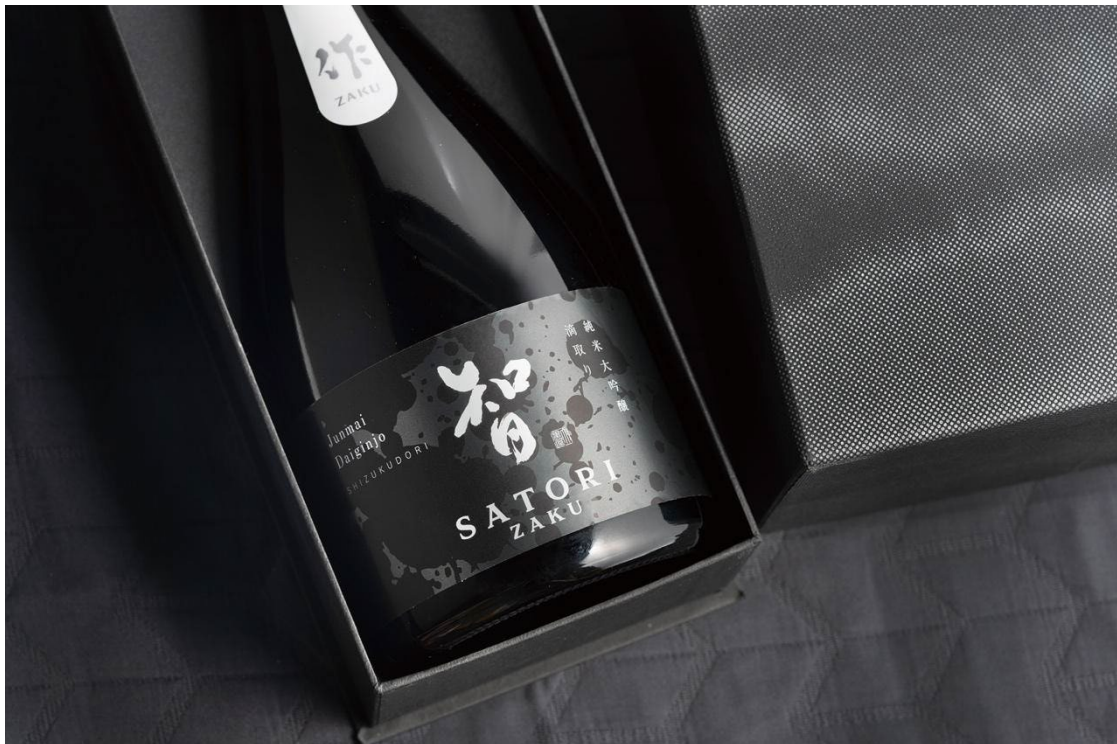
清水清三郎商店・日本酒の代表銘柄「作 特撰酒 智 純米大吟醸 滴取り」

創業155年を迎える清水清三郎商店は、2021年1月に新工場を稼働させ、生産能力を従来の1.5倍に拡大。日本酒の輸出額は2022年まで13年連続で過去最高を更新しています。また、世界で最も権威のあるワイン品評会「IWC・SAKE部門」、フランスで2017年より開催されているソムリエによる日本酒コンクール「Kura Master」や、2001年より毎年開催されている日本国外で最も歴史の長い日本酒の品評会「全米日本酒飲評会」など、海外のコンクールでも栄誉ある賞を多数獲得するなど、代表銘柄「作（ZAKU）」は名実ともに日本を代表するSAKEブランドの一つにまで成長しました。