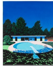
Lot 271 永井 博 Untitled 2021 Estimate: 1,000,000 - 1,500,000 JPY