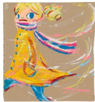
Lot 279 ロッカク アヤコ Untitled 2006 Estimate: 2,500,000 - 3,500,000 JPY