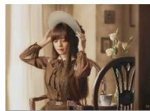
Lot 258 山本 大貴 Remains of the day 2013 Estimate: 3,500,000 - 5,500,000 JPY