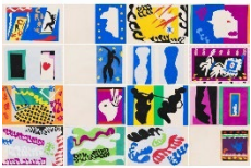
Lot 343 アンリ・マティス 16 plates from portfolio 'Jazz' (Duthuit No. 22) 1947 Estimate: 4,000,000 - 7,000,000 JPY

※オンラインカタログ： https://www.sbiartauction.co.jp/auction/catalogue/129 （2025年3月24日（月）公開予定）