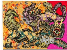
Lot 289 小松 美羽 山犬様 収穫の時 歎び 2018 Estimate: 1,200,000 - 1,800,000 JPY