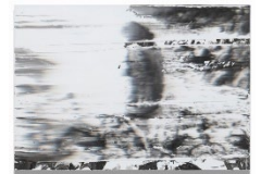
Lot 348 アンディ・デントラー Waterfall crossing 2010 Estimate: 1,500,000 - 2,500,000 JPY