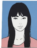
Lot 281 KYNE Untitled Estimate: 3,000,000 - 5,000,000 JPY