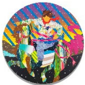
Lot 263 松山 智一 Spotlight Seduction Estimate: 6,000,000 - 9,000,000 JPY