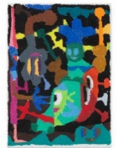
Lot 256 中園 孔二 無題 2015 Estimate: 800,000 - 1,400,000 JPY