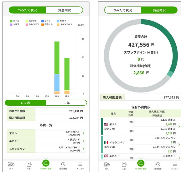
「つみたて状況」画面