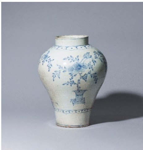
「李朝染付盆栽花鳥文壺」

国境を越え、時代を超えて愛蔵されてきた韓国芸術の優品をこの機会にぜひご覧ください。