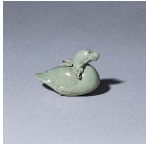
「高麗青磁鴨形水滴」