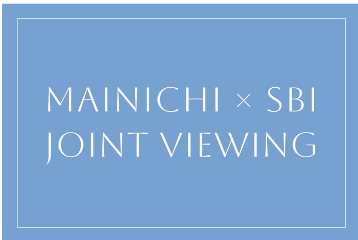
MAINICHI x SBI JOINT VIEWING コンセプトビジュアル