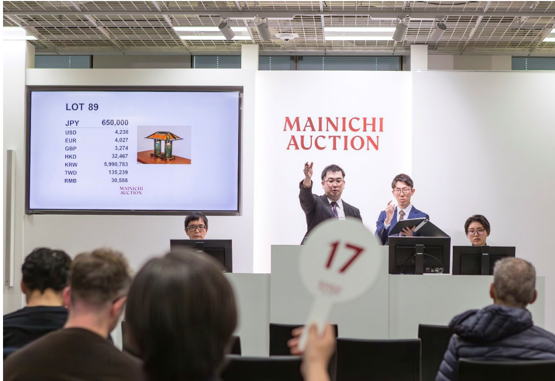
毎日オークション

毎日オークションは、「私たちは、すべての人と世界をアートでつなぐ「架け橋」となり、文化的で豊かな社会の実現をお手伝いします。」というパーパスのもと、アートオークション事業を通じて、公明正大な取引が保証される二次流通市場の提供や文化の継承に貢献しています。創業は1973年。1989年に美術品に特化した公開型オークション事業をスタートし、アート作品をはじめ、西洋装飾美術や日本陶芸・古美術・ジュエリー・時計・酒類など幅広いジャンルを取り扱っています。年間30回以上のオークション開催、年間出品数3万ロット、日本最大級の取り扱い点数を誇ります。さらに国内の主要オークション会社におけるシェア率は42.49%（※）に及び、毎日オークションは日本における美術業界のリーディングカンパニーとして、多様なお客様の想いや価値を未来へ繋ぎ続けています。