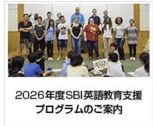
2026年度SBI英語教育支援プログラムのご案内

<入力項目>施設名、郵便番号、住所、電話番号、FAX番号、メールアドレス、担当職員氏名、引率予定職員氏名、参加希望人数、参加児童氏名、性別、学年 (参加児童3名以上5名以内の入力をお願いいたします)