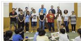
2020年度SBI英会話教育支援プログラムのご案内