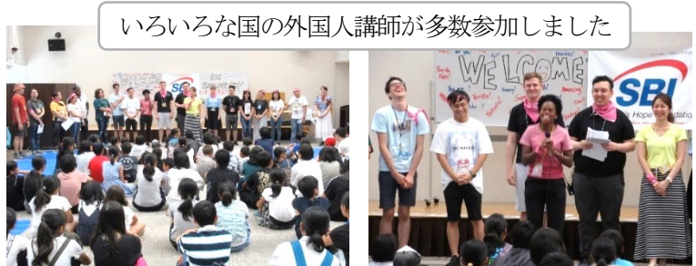
いろいろな国の外国人講師が多数参加しました