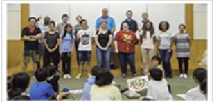
2022年度 SBI 英語教育支援 プログラムのご案内

本件についての問い合わせ先 (受付時間：平日 AM10:00～PM5:00) 〒106-6019 東京都港区六本木 1-6-1 泉ガーデンタワー19F 公益財団法人 SBI 子ども希望財団 TEL：03-6229-1003 FAX：03-3582-0686 E-mail：sbichildren@sbigroup.co.jp